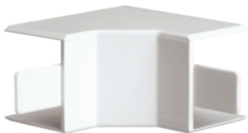
tehalit.LF/ateha Kąt wewnętrzny 40x40mm biały