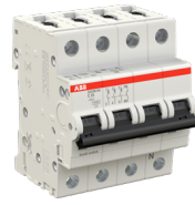
ABB Eco Solutions™