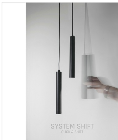
SYSTEM SHIFT CLICK & SHIFT