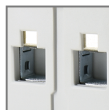
pojemność zacisków max. 25mm 2