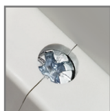
zaciski ze stali ocynkowanej