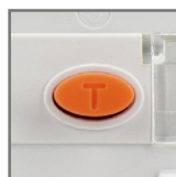
przycisk kontrolny TEST