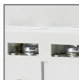
możliwość połączenia za pomocą szyn grzebieniowych