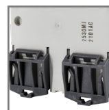
montaż na szynie DIN35